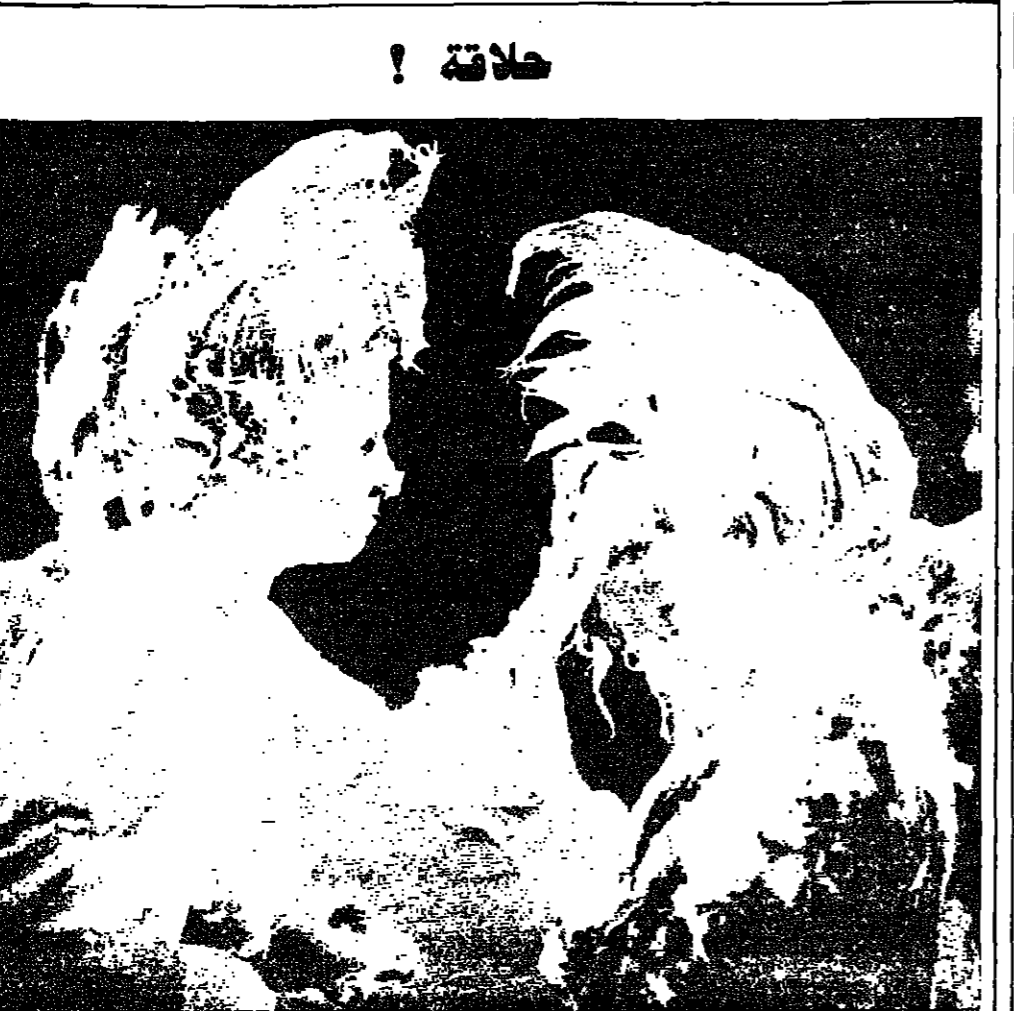
اشترك قرابة ١٧ طالباً وطالبة في هذا العراك، الذي استعمل فيه اكثر من ١٥ علبة من معجون الحلاقة (اليسار) وانجي مور، تمزغ احداهما الاخرى برغوة الرزاد. كولوبوس (أوهيو)